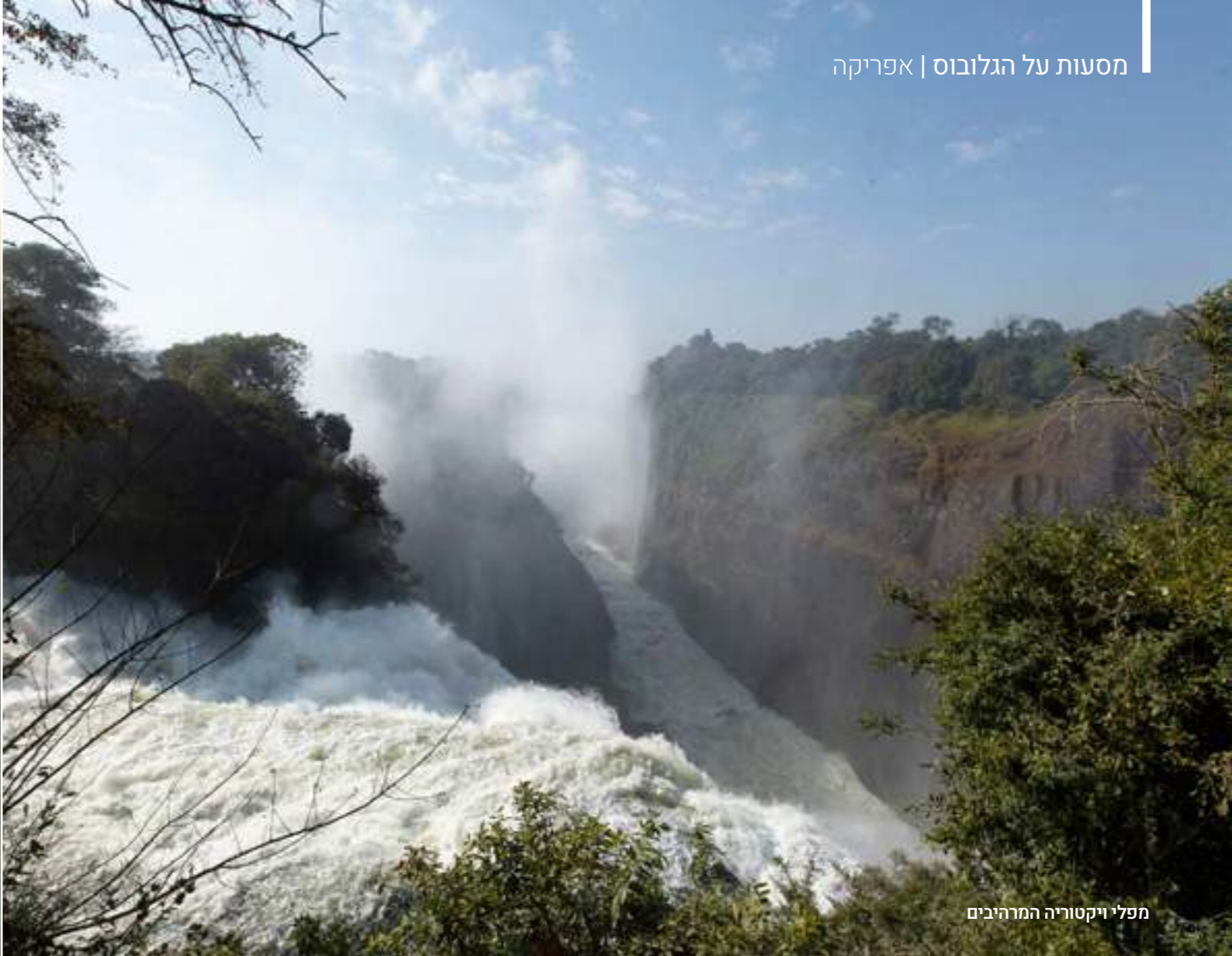
מפלי ויקטוריה המרהיבים