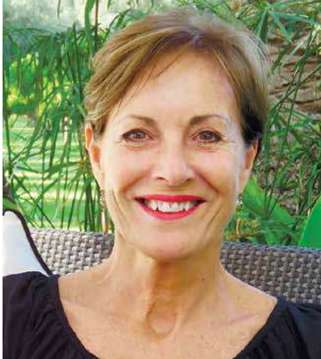
פיפה הנקינסון. ענף מסחרי תחתית לרדאר

הציד הזה בשטח סגור או מוגבל הוא אמנם הגרסה המודרנית של מסעות הציד הארוכים, אלה שמשכו פעם את העשירים - ואת המינגווי - לאפריקה. אבל זו גרסה אכזרית במיוחד, מש- חק לא הוגן. רבים אמנם יגידו שציד בכלל, בכל צורה ואופן, הוא אכזרי ולא הוגן. אלא שלציד המסורתי יש כלל אחד פשוט - בעל החיים יכול לחמוק. הוא יכול לברוח, להסתתר, להציל את עורו. דינו לא נחרץ מראש. בציד בשטח מוגבל אין סיכוי שזה יקרה. כאן המארגנים שיחררו את האריה הניצוד באותו בוקר במתחם מגודר. אין לו לאן לחמוק. המשחק מכור. התופעה הזאת מוכרת כבר 20 שנה בקירוב. בדרום אפריקה היא עיסוק חוקי לחלוטין וכמה ניסיונות משפטיים לאסור אותה כשלו. אלא שבעשור האחרון היא תפסה תאוצה, וכך חמש השנים האחרונות אף הוכפל הנפח שלה. ההערכה היא שבכל יום נורים בדרום אפריקה שלושה אריות בציד כזה, וכיום זו אחת הסוגיות הסכיבתיות המטריות והמוזעות ביותר עבור שומרי הטבע ואוהבי בעלי החיים.