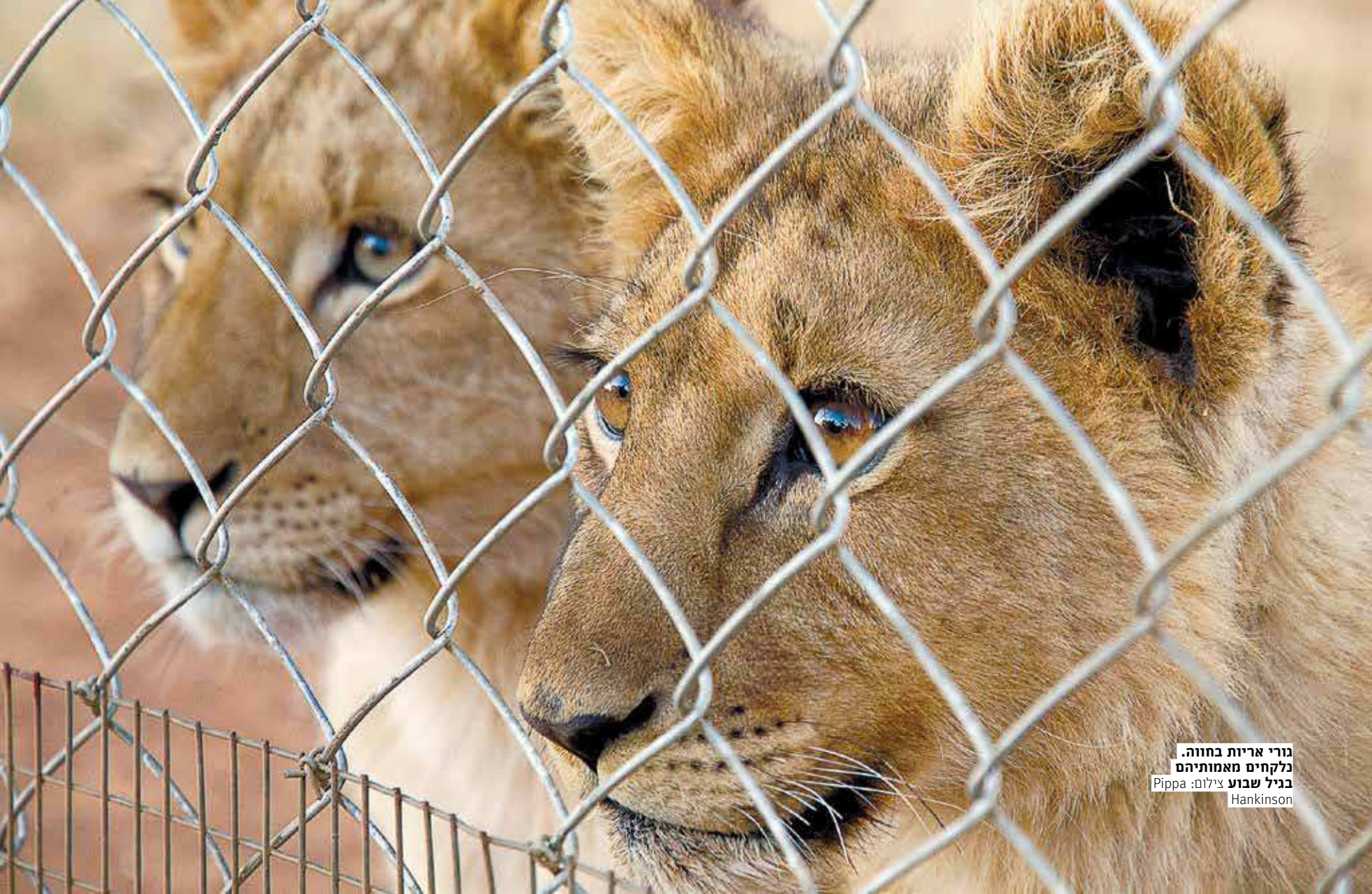
גורי אריות בחווה. נלקחים מאמותיהם בגיל שבוע

התופעה הזאת מצליחה לזעזע אפילו חובבי ציד ותיקים: טיולים המציעים לתייר האמיד לצוד אריה בתוך שטח קטן ומגודר. הסרט "אריות הדמים" מציג את אחד מצדדיה האפלים ביותר של התיירות באפריקה, וחושף את היקפיה המטרידים של התופעה. כעת מספרת האשה שמאחורי הסרט, פיפה הנקינסון, מה עושים כשבעל חווה לגידול אריות לציד רודף אחריו עם רובה משה גלעד