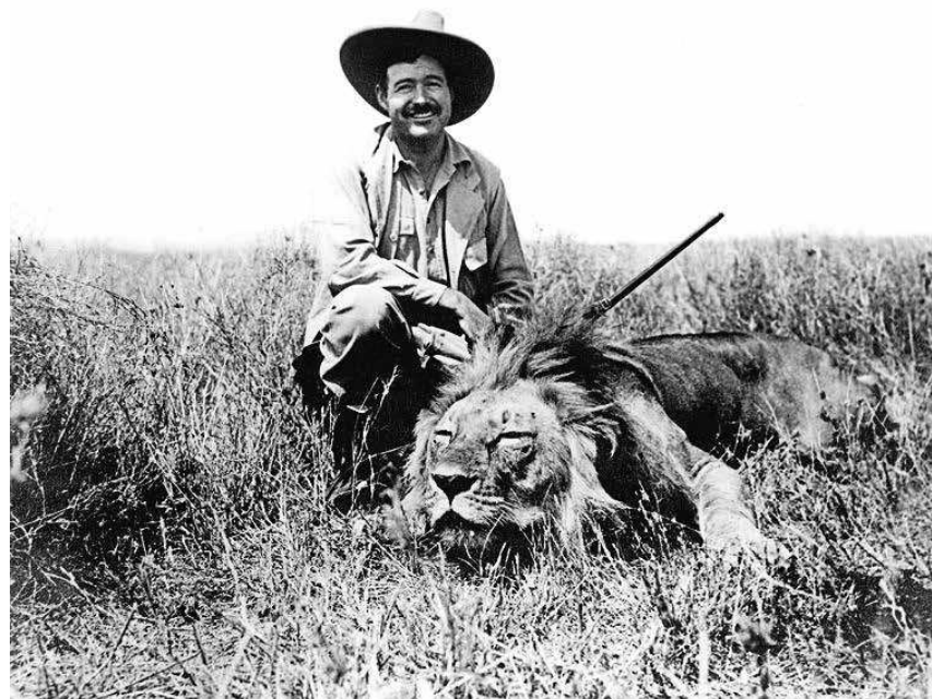
ארנסט המינגוויי. מתהפך בקברו