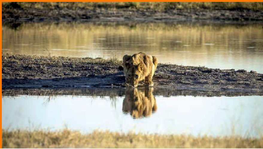
אריה בשמורת וואנגי בזימבבואה